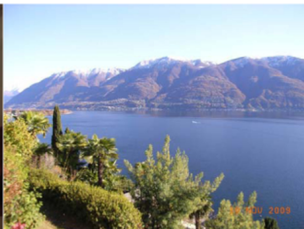
Aussicht vom Gartenhaus